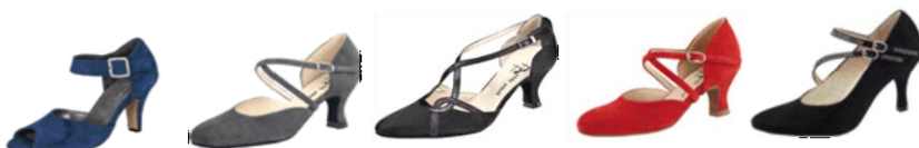
Modelle TOP TANZ