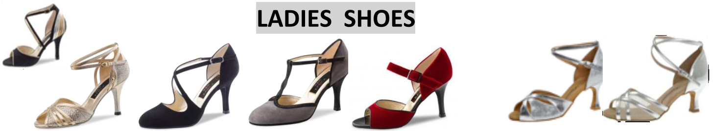
Modelle NUEVA EPOCA von Werner Kern Modelle nur auf Bestellung – € 189,00